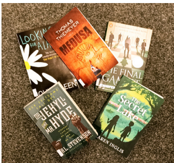
Bücher in englischer Sprache

Seit Dezember 2022 freuen wir uns auch, dass wir neben den Kindern aus unserem Kindergarten und den beiden Volksschulen nun auch die Kleinsten „Kindergruppe Glückskäfer“ regelmäßig in unserer Bücherei begrüßen dürfen!