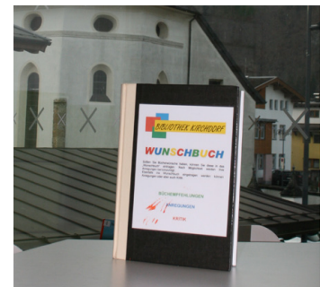
Wunschbuch für deine Buchwünsche oder Anregungen