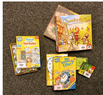
Spiele für alle Altersklassen