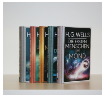
Klassiker der Literatur