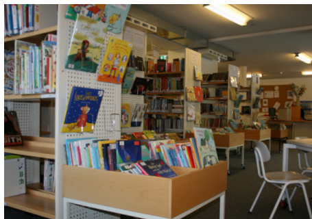
Serienbücher für Kinder