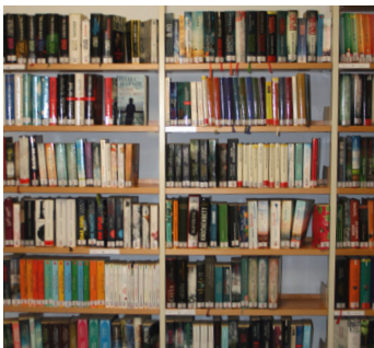
Krimi, Thriller, Romane und viele Sachbücher