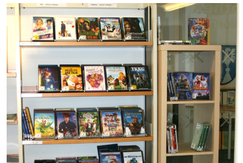
Hörspiele und DVD's